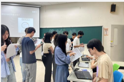
虛擬人生遊戲-買股票